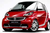
Nouvelle smart fortwo